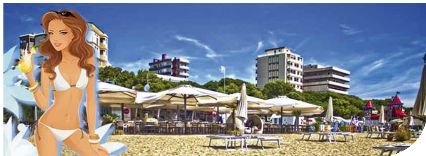
Una bella immagine della pubblicità dei Bagni Ausonia

Chi in questi anni ha investito nella qualità alberghiera è stato ripagato. In albergo o in appartamento, è appena il caso di evidenziare che l'ospite oggi ha richieste di maggiore confort che in passato, dall'aria condizionata alla copertura della rete internet, dalla pay-tv alla possibilità di tenere il cane. Per promuovere una vasta azione di recupero edilizio privato sarebbe necessario prevedere forme di incentivi, magari legate all'obbligo per un certo numero d'anni di mettere sul mercato delle locazioni gli alloggi ristrutturati a regime controllato.