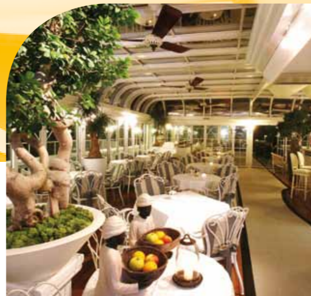
Scorcio dello splendido terrazzo - ristorante del Gran Hotel Italia Palace di Sabbiaadoro