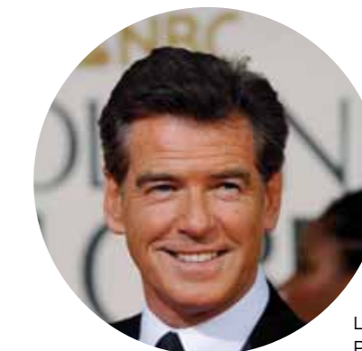
L'attore Pierce Brosnan