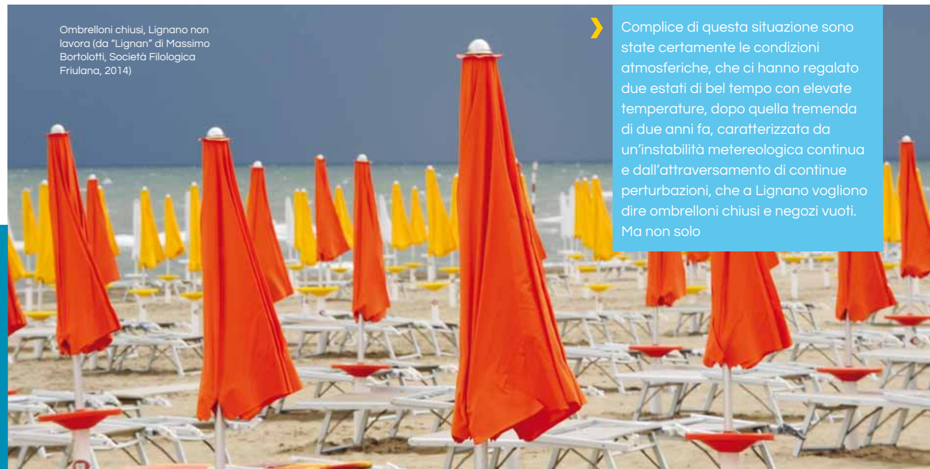
Ombrelloni chiusi, Lignano non lavora (da "Lignan" di Massimo Bortolotti, Società Filologica Friulana, 2014)

Complice di questa situazione sono state certamente le condizioni atmosferiche, che ci hanno regalato due estati di bel tempo con elevate temperature, dopo quella tremenda di due anni fa, caratterizzata da un'instabilità metereologica continua e dall'attraversamento di continue perturbazioni, che a Lignano vogliono dire ombrelloni chiusi e negozi vuoti. Ma non solo