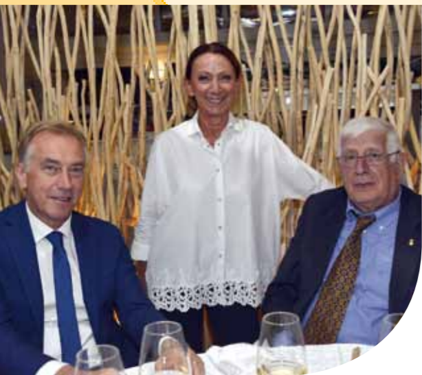
Fotocronaca della serata