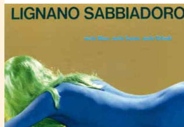
La donnina blu, Lignano degli anni d'oro

Complice di questa situazione sono state certamente le condizioni atmosferiche, che ci hanno regalato due estati di bel tempo con elevate temperature, dopo quella tremenda di due anni fa, caratterizzata da un'instabilità metereologica continua e dall'attraversamento di continue perturbazioni, che a Lignano vogliono dire ombrelloni chiusi e negozi vuoti. Ma non solo