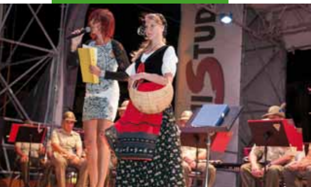
Alcune immagini della serata di solidarietà per il terremoto del centro Italia, organizzata dal gruppo Alpini locale